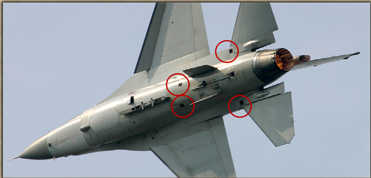
A törzsbe épített zavarótölteteket tartalmazó kazetták.

jellemzően csak radarzavaró tölteteket táraznak be így a törzsben levő kazettákba 4x15 infracsapda tölthető be.