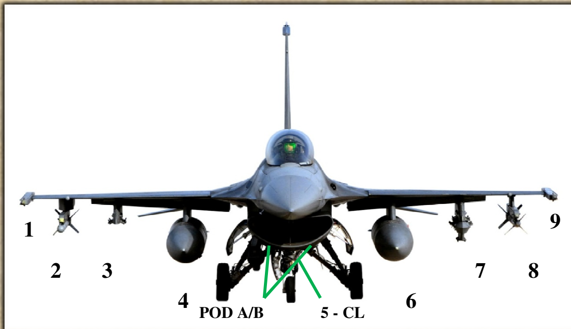
Az F-16C/D változatok felfüggesztési pontjai.