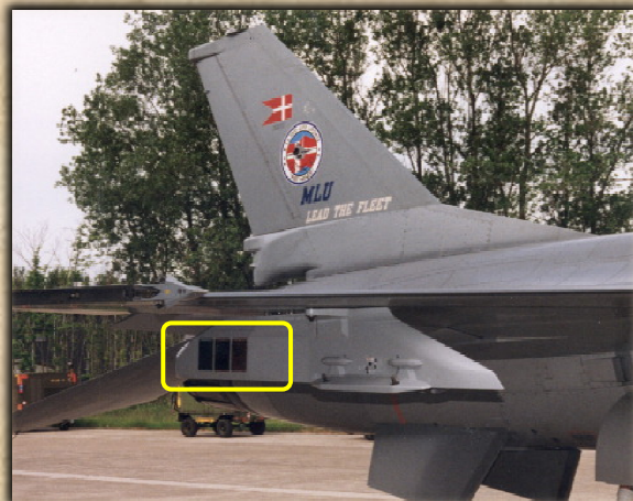
PIDS egy dán F-16MLU gépen.

Némelyik változata képes vonatott rakéta csali alkalmazására is, 90 az 1999-es Allied Force hadműveletben igen eredményesen szerepelt bizonyos légvédelmi rendszerek ellen az elektronikai zavarással kombinálva.